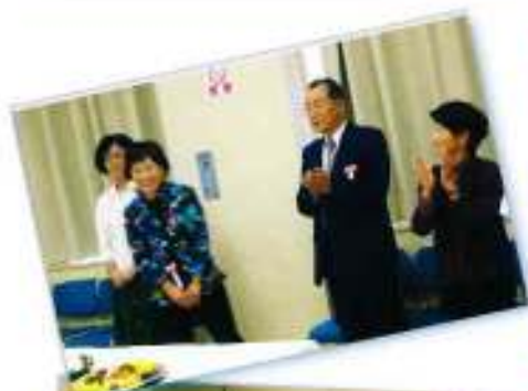
アイセス誕生から20年 写真で見る交流会