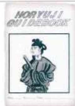
先生たちと編集した両中学校 共通ガイドテキスト