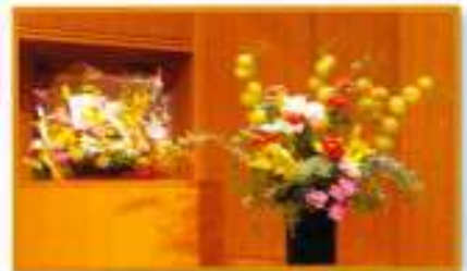
左：中宮寺日野西光尊門跡寄贈 右：生花担当班の作品