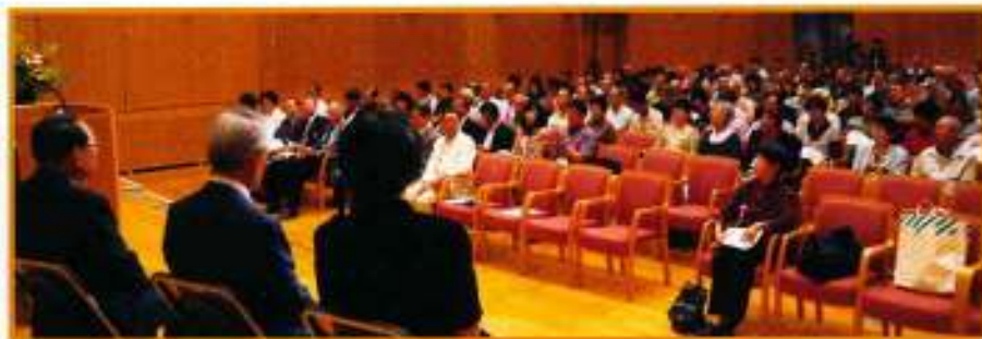
式典・講演会開始を待つお客様