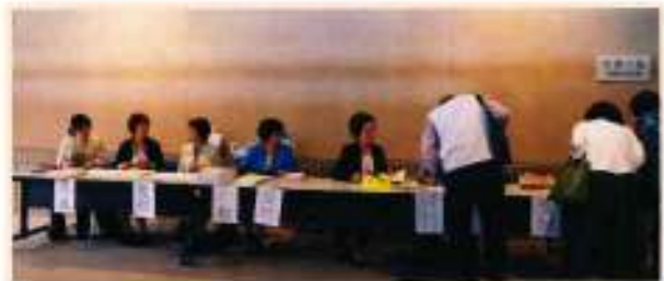
斑鳩ホール式典・講演会聴講受付風景