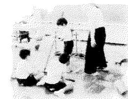
ほうきの使い方指導（小）