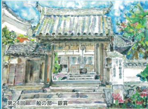
第24回 一般の部 銀賞