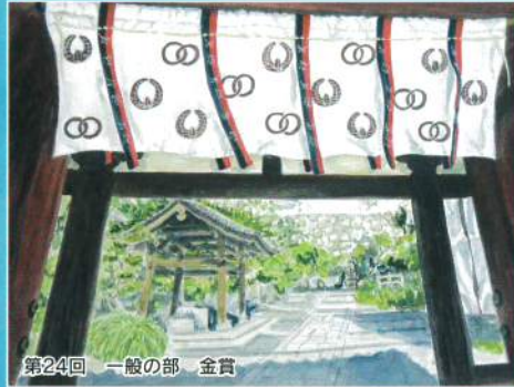
第24回 一般の部 金賞