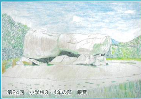
第24回 小学校3・4年の部 銀賞