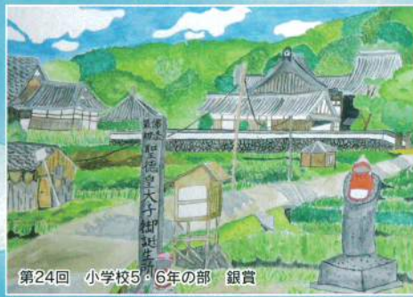
第24回 小学校5・6年の部 銀賞