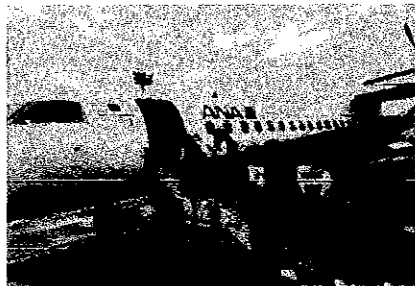
飛行機で長崎空港まで

今年度の修学旅行は、感染症の位置づけが引き下げられたこと、生徒たちの体調が万全であったことを踏まえ、行き先を「近場」から「九州」に変更しました。行きは飛行機で長崎空港までひとつ飛び、帰りは博多駅から新幹線を利用。九州での移動は観光バスとし、それによって活動の範囲が広がりました。初日はハウステンボスで晴天のもと活動ができましたが、2日目の平和学習では想像を超える大雨のため、計画通りの活動とはなりませんでした。学校代表して生徒一人一人の平和への願いを届けてくれたことと思います。少し雨の影響を受けましたが、無事修学旅行を終えることができました。