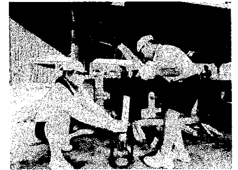
カレー作りでの薪割り