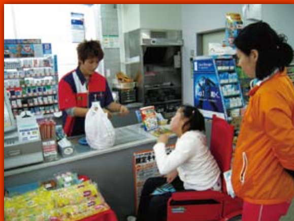
校内宿泊学習「買い物」(小学部)