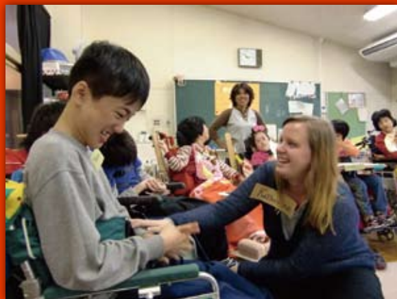
英会話学習(中学部)