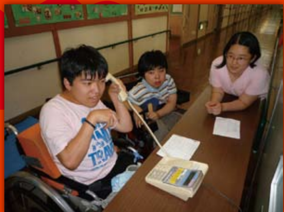
総合的な学習の時間「社会参加学習」(高等部)