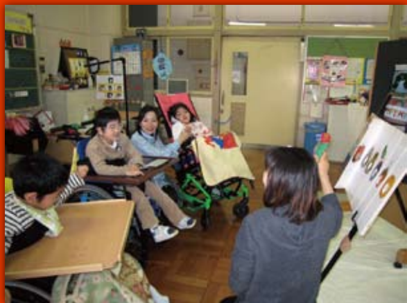
グループ学習「みるきく」(小学部)