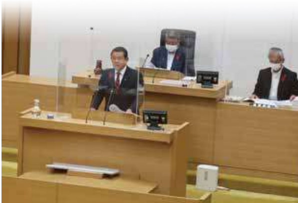
ワクチン接種記録の延長を求める意見書可決 R4.10.24

事象がおきた際、5年経過後にはワクチンを接種したかどうかの接種記録が残っていないという状況になり、医療訴訟において重要な証拠である接種記録を提出できなくなります。 そこで、新型コロナウイルスやHPVワクチン等の接種を受ける県民の命を守り、将来に渡って責任を持つとの考えやリスクマネジメントの側面からも、接種記録を5年以上保管するように定める措置を国が行うよう強く求めます。 以上、地方自治法第99条の規定により意見書を提出する。 令和四年十月二十四日