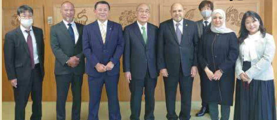
モハメッドオマーン駐日特命全権大使(左から5番目)と共に奈良県荒井知事を表敬訪問 R4.12.5

更に大使は今年には日本とオマーン国交50周年でありますので、奈良県とこれまで以上に友好関係を深めたいと、特にオマーンはシルクロードの出発点かもしれないので、ゴールである奈良県とは文化交流に留まらず経済においても協力をしたいと述べられました。私は文化国際観光都市で平城京を有する奈良県は、自由で開かれたインド太平洋の実現のためにアジアと中東、アフリカの「連結性」を向上させ地域の安定と経済的發展に寄与するために中東の親日国のオマーン国と奈良県との地方都市外交は大変重要であり、今後ますます友好関係を深めなければならぬと決意を新たにしました。