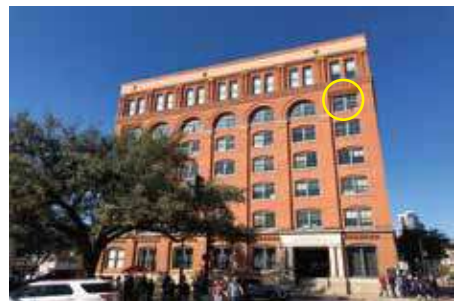
JFケネディ大統領暗殺犯人が狙撃したとされる教科書倉庫ビル6F〇印。