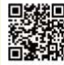
メール投稿フォーム