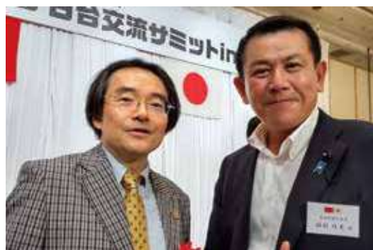
日台交流サミットin高知で門田隆将氏と安倍総理銃撃事件について意見交換 R4.10.15

は「暴力に奈良の民主主義は屈しない、決してこの事件を忘れない」と言う奈良市民の心意気象徴とするべきであると思うからです。勿論近隣への配慮をしつつも、このような顕彰碑等は後世に伝えるものであるから行政が設置するのが相応しいと思うが、行政がしないと言っているのであれば民間有志が集まって設置するのも良いと思う。この事は門田隆将先生との会話の中でも話題が上がった。 尚これ迄に大正十年原敬総理の暗殺現場や昭和五年に浜口雄幸首相襲撃現場、更に坂本龍馬の近江屋事件現場、更にJFケネディ大統領暗殺現場にも目印と近隣にメモリアル等が設置されていると知人が知らせてくれた。(写真添付) 何年か後にこの事件は歴史教科書に掲載されるかもしれないが、もし何も無ければ、いつかはこの事件も風化してしまい、その現場が分からなく成ると言う事は、歴史から抹殺する事に繋がるのではと懸念しています。ぜひ県民の民様のご意見を当事務所にお寄せ頂きたい。