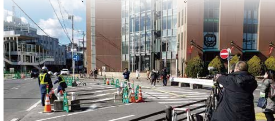
安倍元総理が暗殺された現場にあったガードレールを奈良市が撤去。その後車道整備で跡は消える。R4年12月19日