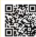
奈良県副反応相談窓口コールセンター