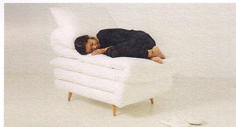
● Sleepy Chair (圖片提供：Daisuke Motogi Architecture)

國內外很多建築師都把這樣的健康觀念植入作品中，希望呈現一般建材及制式居住空間所無法給予的優質感，如同我們在Tadashi Yoshimura的作品「Wood Block House」所看到的運用。利用片狀木材搭造出編織感的結構，不只是讓居住者接觸自然素材這麼簡單，而是運用交織間隙所達到的透光效果來改變傳統窗櫺及一般窗簾的樣貌，進而擴展了原有的生活體驗。除了外形上的創新，功能上也有所突破。交織中所產出的空間更足以容下一位小朋友無拘束地「嵌入」，實在是非常討喜的設計！這樣的構想改變了屋內生活的形態及動線，更增添了互動來提高自在感所帶出的幸福。生活中能如此接觸