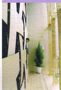
● Wood Block House

從慢活、樂活到優活，一直以來人們所談的都是圍繞在所謂的生存品質。慢活是一種態度，以一種悠然的步調，回歸大自然根本的節奏，達到一定的和諧。樂活乃至優活則是一種實踐，在受限的環境下，為自己找出一個更自在的生活模式。快樂存在於平衡之間，在一個無須拉扯與抗衡的環境，幸福感自然產生。為了要達到這所謂的平衡，我們在身心的感覺及感知上都需要適度的調節。也許是藉由居住環境的轉移，也可能是透過行為模式的改變，但最終的目的都是讓生活趨於更加和諧的狀態。